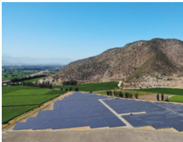
Proyectos de generación de energía renovable financiados mediante un bono verde emitido por Grenergy Renovables

La redefinición de la oferta financiera de COFIDES ha dado lugar a operaciones inéditas en la historia de la Compañía, como la suscripción de 3 bonos emitidos en el MARF, uno de ellos verde